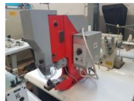
Referencia: BOR-014 MAQUINA PONER OJALES AUTOMATIC... Año: . Marca: SICOM