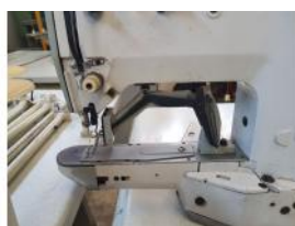
Referencia: BOR-011 MAQUINA COSER DE 2 HILOS Año: . Marca: .