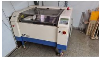
Referencia: JSO-012 LASER DE MARCACION Y CORTE DE ... Año: 2002 Marca: INTERLAS TECHNOLOGY