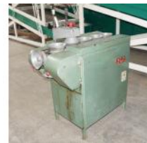
Referencia: TNA-014 MAQUINA PARA REDONDEAR CONO Año: . Marca: FITÉ