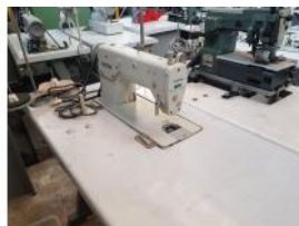
Referencia: BOR-010 MAQUINA COSER BROTHER Año: . Marca: BROTHER