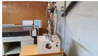
Referencia: JSO-014 MAQUINA PARA LAVAR MEDIANTE PE... Año: . Marca: SILC