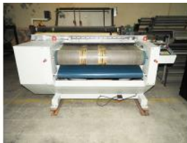
Referencia: CGR-045 MAQUINA LANIGRAFIA Año: 2011 Marca: CAPDEVILA