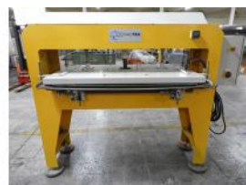
Referencia: CGR-010 MAQUINA DE TERMOFIJAR Año: 2001 Marca: COSMOTEX