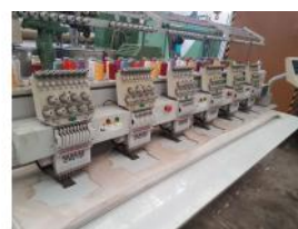
Referencia: BOR-002 BORDADORA FEIYA Nº 974 Año: 2004 Marca: FEIYA