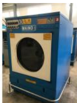
Referencia: ATG-006 SECADORA Año: 1998 Marca: MAINO