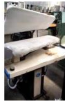
Referencia: CUM-024 PLANCHA INDUSTRIAL Año: . Marca: PANTEX