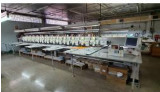
Referencia: JSO-001 BORDADORA DE 12 CABEZALES Año: 2005 Marca: SWF