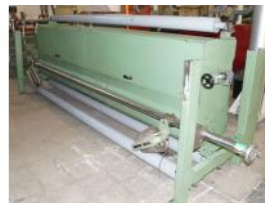
Referencia: TIR-010 CAJON PARA EL CEPILLADO DE LA ... Año: 2001 Marca: SAMIT