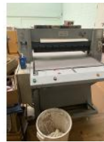
Referencia: TTR-009 GUILLOTINA PARA DENTAR TEJIDOS Año: . Marca: BOSCH