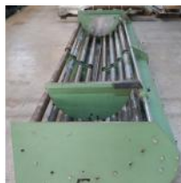
Referencia: TIR-007 LECHO DE CURRONES DE ACCIONAMI... Año: . Marca: .