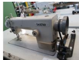
Referencia: BOR-012 MAQUINA COSER BROTHER Año: . Marca: BROTHER