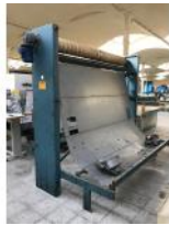
Referencia: SDS-002 JOTA ACUMULADORA Año: 1995 Marca: SAMIT