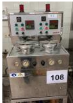
Referencia: BRS-108 AUTOCLAVE Año: 1993 Marca: UGOLINI