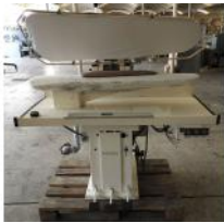
Referencia: TWD-001 PLANCHA INDUSTRIAL Año: . Marca: PANTEX