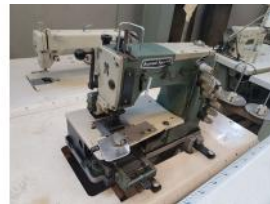
Referencia: BOR-009 MAQUINA COSER KANSAI-SPECIAL Año: . Marca: KANSAI-SPECIAL