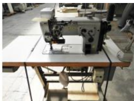
Referencia: MRT-023 MAQUINA DE COSER Año: . Marca: DURKOPP