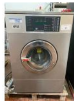
Referencia: MIC-005 LAVADORA Año: 1997 Marca: .