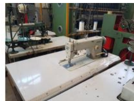
Referencia: BOR-016 MAQUINA COSER BROTHER DE 2 HILOS Año: . Marca: BROTHER