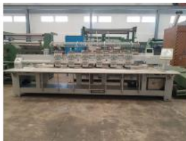
Referencia: BOR-001 BORDADORA FEYA N°2027 Año: 2003 Marca: FEIYA