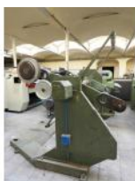
Referencia: AZC-043 DESBOBINADOR Año: . Marca: .