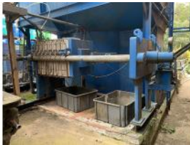
Referencia: CGR-054 PRENSA Año: . Marca: TEFSA