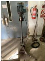
Referencia: CGR-023 AGITADOR COWLESS TELESCOPICO Año: . Marca: .