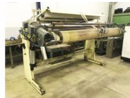
Referencia: SDS-006 SALIDA CARRO BOTA Año: . Marca: .