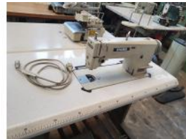
Referencia: BOR-005 MAQUINA COSER SIGMA BROTHER IN... Año: . Marca: SIGMA - BROTHER INDUSTRIES