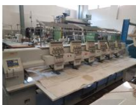
Referencia: BOR-004 BORDADORA FEIYA Nº 2089 Año: 2003 Marca: FEIYA