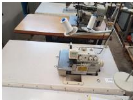
Referencia: BOR-006 MAQUINA COSER VENUS Año: . Marca: .