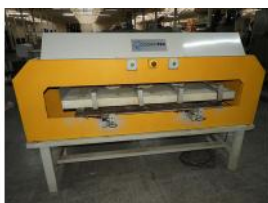
Referencia: CGR-009 MAQUINA DE TERMOFIJAR Año: 2000 Marca: COSMOTEX