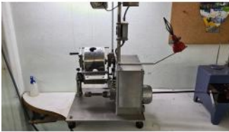
Referencia: JSO-008 TRANSCANADORA DE HILO Año: . Marca: .