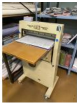
Referencia: TTR-013 GUILLOTINA PARA DENTAR TEJIDOS Año: . Marca: PIGUILLEM