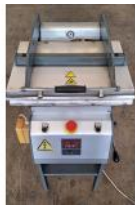
Referencia: AV7-028 PLANCHA DE SUBLIMACION Año: 1998 Marca: IPT