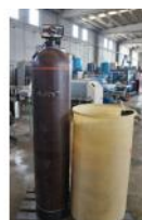
Referencia: CHS-015 DESCALCIFICADOR Año: . Marca: OMNISOL