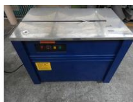
Referencia: CGR-044 FLEJADORA SEMI AUTOMÁTICA Año: . Marca: INCARPACK