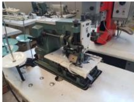
Referencia: BOR-015 MAQUINA COSER KANSAI-SPECIAL N... Año: . Marca: KANSAI-SPECIAL