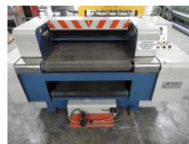
Referencia: CGR-003 PLANCHA DE CONTINUO Año: 2000 Marca: CAPDEVILA