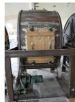
Referencia: CGR-053 BOMBO PARA CURTIDOS DE PIELES Año: . Marca: VENTURA