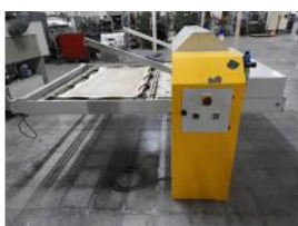
Referencia: CGR-008 MAQUINA DE TERMOFIJAR Año: 2002 Marca: COSMOTEX