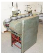
Referencia: TNA-015 MAQUINA PARA REDONDEAR CONO Año: . Marca: FITÉ