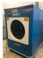
Referencia: ATG-005 SECADORA Año: 1998 Marca: MAINO