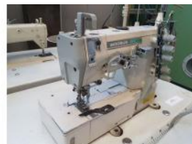
Referencia: BOR-013 MAQUINA DE COSER WOOSUN Año: . Marca: WOOSUN