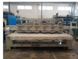
Referencia: BOR-003 BORDADORA FEIYA Nº 2088 Año: 2003 Marca: FEIYA