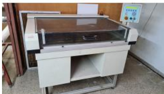
Referencia: JSO-013 LASER DE MARCACION Y CORTE DE ... Año: 1998 Marca: RICAMAR