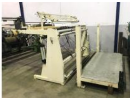
Referencia: SDS-005 SALIDA CARRO BOTA Año: . Marca: .