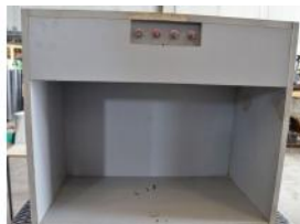
Referencia: CHS-021 CAJA DE LUCES Año: . Marca: .