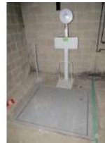
Referencia: SER-102 BASCULA Año: . Marca: DINA