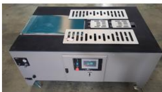
Referencia: LVG-008 MAQUINA PARA PLEGADO DE CAMISETAS Año: . Marca: EXPERPRINT41