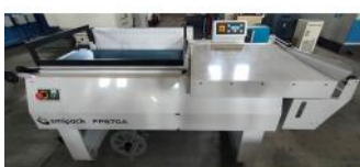
Referencia: LVG-007 EMPAQUETADORA ANGULAR Año: 2018 Marca: SIMIPACK