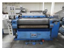
Referencia: CGR-046 MAQUINA LANIGRAFIA Año: . Marca: CAPDEVILA