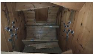
Referencia: CGR-051 BOMBO PARA CURTIDOS DE PIELES Año: 2002 Marca: .