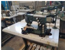
Referencia: BOR-017 MAQUINA COSER KANSAI-SPECIAL Año: . Marca: KANSAI-SPECIAL