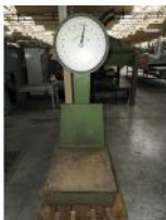
Referencia: CGR-062 BASCULA ANALÓGICA Año: . Marca: BARCELO