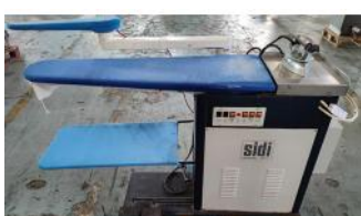
Referencia: LVG-010 MESA DE PLANCHADO ASPIRANTE Año: . Marca: SIDI MODIAL S.R.L