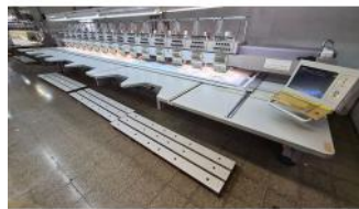
Referencia: JSO-003 MAQUINA DE BORDAR DE MULTIPLE ... Año: 2005 Marca: ZSK