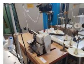
Referencia: BOR-007 MAQUINA COSER FANDOS BROTHER Año: . Marca: FANDOS BROTHER