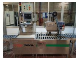
Referencia: MOR-084 TREN DE PESADO Y ETIQUETADO Año: 2004 Marca: TAVIL