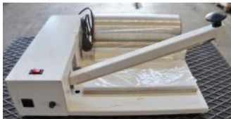
Referencia: ICD-018 SELLADORA DE BOLSAS Año: . Marca: SRINCK-A-PACK