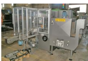
Referencia: PUG-002 ENFARDADORA Año: 2003 Marca: IMA