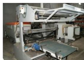
Referencia: LVS-001 MAQUINA DE EMBALAJE Año: . Marca: IM2