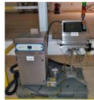
Referencia: NUT-012 MARCADOR LASER Año: 2005 Marca: DOMINO