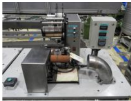
Referencia: CYP-029 ETIQUETADORA Año: . Marca: .