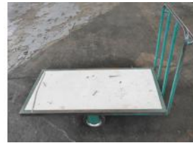
Referencia: MRT-082 CARRO DE TRANSPORTE Año: . Marca: .