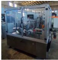
Referencia: FLT-001 ETIQUETADORA LINEAL DE DOBLE C... Año: 2005 Marca: ETIMA