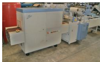
Referencia: SON-006 EMPAQUETADORA Año: 1997 Marca: CB EMBALLAGE