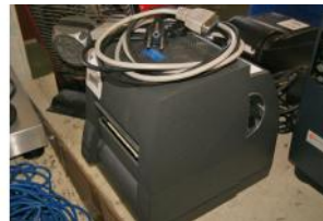
Referencia: SON-002 IMPRESORA DE ETIQUETAS Año: . Marca: CITIZEN