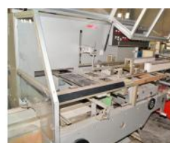
Referencia: PUI-002 ESTUCHADORA Año: 1999 Marca: CAM 7 SRL