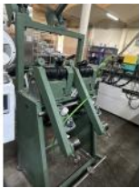
Referencia: ZIP-028 BOBINADORA Año: . Marca: MOTOCONO