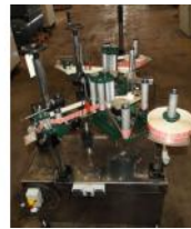
Referencia: AFG-005 ETIQUETADORA DE DOBLE CABEZAL Año: 2007 Marca: REVERSIBLE LABELLERS COMPANY