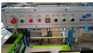
Referencia: ICS-002 EMBOLSADORA HORIZONTAL Año: . Marca: BELCA