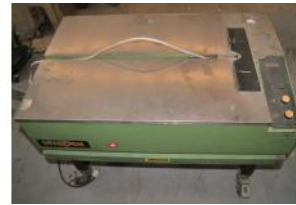
Referencia: ANT-017 FLEJADORA SEMI-AUTOMATICA Año: . Marca: STRAPEX