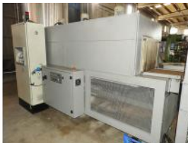
Referencia: AFG-016 HORNO DE RETRACTILADO Año: 2007 Marca: DIDEM