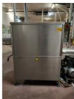
Referencia: MOR-079 TANQUE DE RETRACTILADO POR INM... Año: 2005 Marca: INELVI