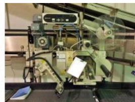
Referencia: NUT-010 IMPRESORA/DISPENSADO RA DE ETIQUETAS Año: 2009 Marca: DOMINO