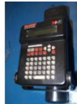
Referencia: BU-066 SISTEMA DE CODIFICACION Año: . Marca: MARSH