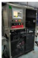
Referencia: NTM-060 DISPENSADOR DE ETIQUETAS Año: 2017 Marca: MACSA ID