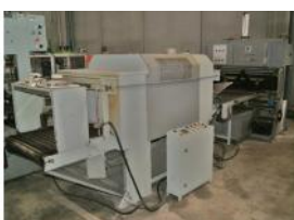
Referencia: LVS-002 MAQUINA DE EMBALAJE Año: . Marca: CIPRO