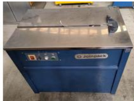
Referencia: ELP-014 FLEJEDORA Año: . Marca: JOINPACK