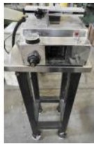
Referencia: ITD-015 MARCADOR DE TINTA PARA CAJAS Año: . Marca: .