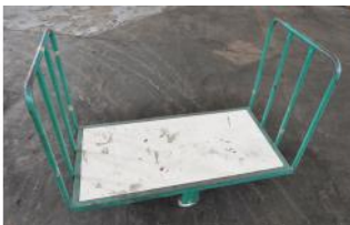
Referencia: MRT-083 CARRO DE TRANSPORTE Año: . Marca: OMAV