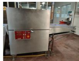
Referencia: MOR-077 TANQUE DE RETRACTILADO POR INM... Año: . Marca: INAUEN