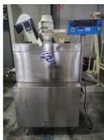
Referencia: SSM-015 TANQUE PARA RETRACTIL Año: 2010 Marca: ZERMAT