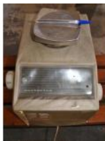
Referencia: PUI-028 BASCULA DE LABORATORIO Año: . Marca: SARTORIUS