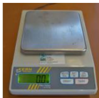
Referencia: NUT-024 BASCULA DE LABORATORIO Año: . Marca: KERN