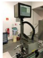
Referencia: PGM-008 ESTACIÓN DE REPASO Y CONTROL Año: 2002 Marca: KRONES