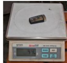
Referencia: PUI-021 BASCULA DE LABORATORIO Año: . Marca: GRAM