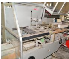
Referencia: PUI-002 ESTUCHADORA Año: 1999 Marca: CAM 7 SRL