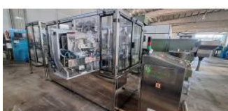
Referencia: EBV-001 LLENADORA/DOSIFICADOR A AUTOMATICA Año: 2016 Marca: ANCIMO