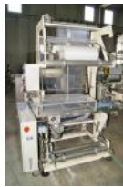
Referencia: NUT-015 ALIMENTADOR DE PLASTICO Año: 1992 Marca: LSP MAEM