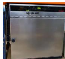
Referencia: NUT-004 ESTUFA BACTERIOLOGICA Y DE CULTIVO Año: . Marca: MEMMERT