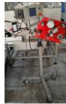
Referencia: FTR-016 CABEZAL DE ETIQUETADO Año: 2012 Marca: RUSÁN