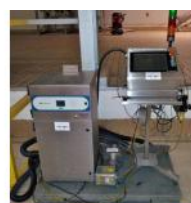
Referencia: NUT-012 MARCADOR LASER Año: 2005 Marca: DOMINO