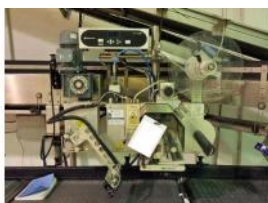
Referencia: NUT-010 IMPRESORA/DISPENSADO RA DE ETIQUETAS Año: 2009 Marca: DOMINO