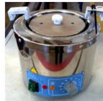
Referencia: BPS-046 BAÑO TERMOSTATICO Año: . Marca: RAYPA