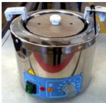
Referencia: BPS-045 BAÑO TERMOSTATICO Año: . Marca: RAYPA