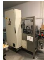
Referencia: PGM-011 DIVISOR DE LÍNEA Año: 1997 Marca: TECMA PACK