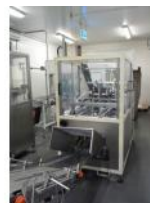
Referencia: PGM-013 FORMADOR DE BANDEJAS Año: 1997 Marca: TECMA PACK