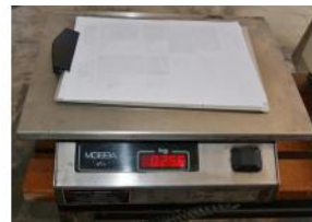
Referencia: PUI-029 BASCULA DE LABORATORIO Año: . Marca: MOBBA