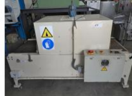
Referencia: GBF-012 TUNEL DE RETRACTILADO Año: . Marca: Hijo de J. PRUNA