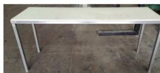
Referencia: MOR-157 MESA INOX CON ENCIMERA Año: . Marca: .