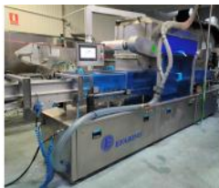
Referencia: NTM-054 LINEA DE TERMOSELLADO Año: 2015 Marca: EFABIND