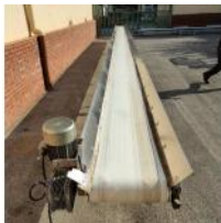
Referencia: PNS-022 CINTA TRANSPORTADORA DE BANDA ... Año: 2003 Marca: MARTIN MAQ