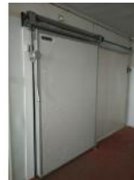
Referencia: FPN-090 PUERTA FRIGORIFICA CORREDERA Año: . Marca: .