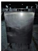
Referencia: GAU-004 HORNO DE RECALENTAMIENTO Año: . Marca: BOURGEAT