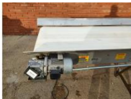
Referencia: PNS-037 CINTA TRANSPORTADORA DE BANDA ... Año: 2003 Marca: MARTIN MAQ