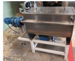
Referencia: NCC-122 MEZCLADORA HORIZONTAL Año: 1973 Marca: IPIASA