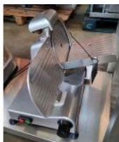
Referencia: PCB-012 CORTADORA DE EMBUTIDOS Año: . Marca: .