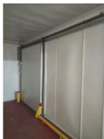
Referencia: FPN-091 PUERTA FRIGORIFICA CORREDERA Año: . Marca: INFRACA