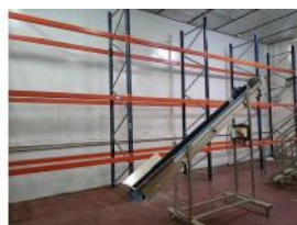
Referencia: TVE-064 ESTANTERIA METALICA Año: . Marca: .