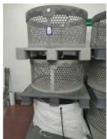
Referencia: TVE-046 CESTAS DE AUTOCLAVE Año: . Marca: .