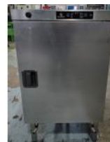
Referencia: GAU-006 HORNO DE RECALENTAMIENTO Año: . Marca: BOURGEAT