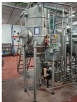
Referencia: TVE-020 TANQUE INOX Año: . Marca: .