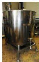
Referencia: LMN-011 CONTENEDOR CALORIGUGADO Año: . Marca: .