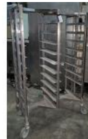
Referencia: GAU-024 CARRO PARA 18 BANDEJAS Año: . Marca: .