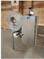
Referencia: MOR-023 ABRIDORA DE MALLA NEUMATICA Año: . Marca: STÉ FERRANDO