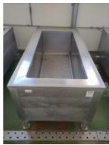
Referencia: AGL-088 COCEDERO INOX Año: . Marca: .