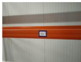
Referencia: TVE-053 ESTANTERIA METALICA Año: . Marca: MECALUX