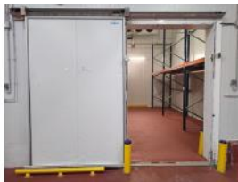
Referencia: FPN-076 PUERTA FRIGORIFICA CORREDERA Año: . Marca: INFRACA