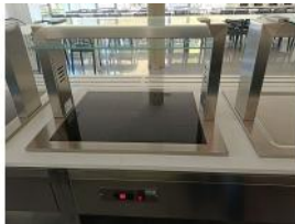
Referencia: CPM-025 PLACA DE CRISTAL PARA EXHIBIR ... Año: 2019 Marca: DISTFORM