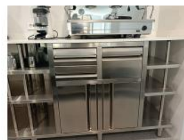
Referencia: CPM-022 MUEBLE CAFETERO Año: 2018 Marca: INFRICO