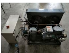
Referencia: MOR-241 EQUIPO DE FRIO Año: 2001 Marca: .