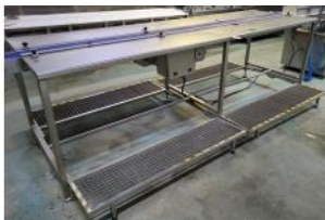
Referencia: NTM-053 MESA DE PREPARACION Año: . Marca: .