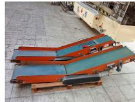
Referencia: PNS-052 CINTA TRANSPORTADORA Año: . Marca: EMPAC S.A