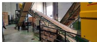
Referencia: MZA-005 CINTA TRANSPORTADORA Año: 2018 Marca: TREICO