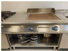
Referencia: CPM-007 PLANCHA DE GAS Año: . Marca: ELECTROLUX