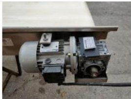
Referencia: PNS-033 CINTA TRANSPORTADORA DE BANDA ... Año: 2003 Marca: MARTIN MAQ