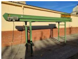
Referencia: PNS-044 CINTA TRANSPORTADORA DE BANDA ... Año: . Marca: .