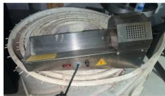
Referencia: MZA-038 ENCAPSULADORA MANUAL Año: . Marca: .