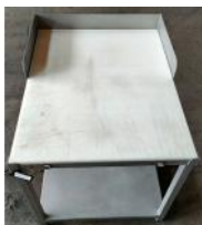
Referencia: MOR-158 MESA INOX CON ENCIMERA Año: . Marca: .