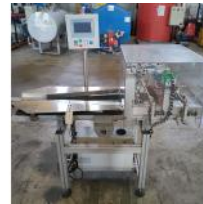
Referencia: SSM-032 ALINEADOR DE BANDEJAS Año: 2017 Marca: VAHC