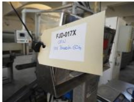
Referencia: FJD-017 BASCULA DIGITAL DE PLATAFORMA Año: . Marca: CEIN