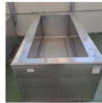
Referencia: AGL-089 COCEDERO INOX Año: . Marca: .