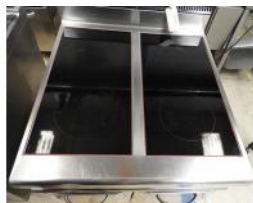
Referencia: AUR-003 COCINA INDUSTRIAL VITROCERÁMI... Año: 2008 Marca: MAS BAGA