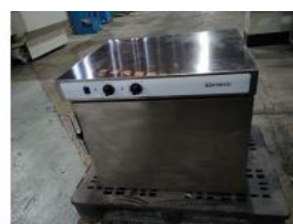
Referencia: GAU-016 HORNO DE RECALENTAMIENTO Año: 2010 Marca: GIORIK