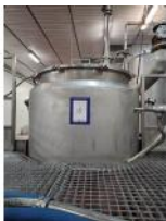
Referencia: TVE-018 TANQUE INOX Año: . Marca: .