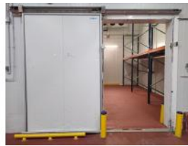
Referencia: FPN-076 PUERTA FRIGORIFICA CORREDERA Año: . Marca: INFRACA