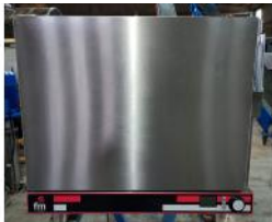
Referencia: GAU-007 HORNO REGENERADOR ELECTRICO Año: . Marca: FM INDUSTRIAL