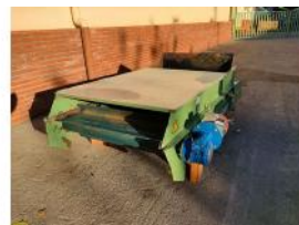
Referencia: PNS-043 CINTA TRANSPORTADORA ELEVADORA Año: . Marca: IMAÑA