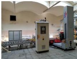
Referencia: ILA-001 PALETIZADOR CARTESIANO Año: 2009 Marca: DNC