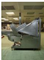
Referencia: MOR-104 LONCHEADORA AUTOMATICA Año: 1994 Marca: DIXIE UNION