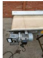
Referencia: PNS-031 CINTA TRANSPORTADORA DE BANDA ... Año: 2003 Marca: MARTIN MAQ