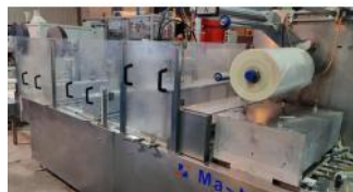
Referencia: SSM-008 TERMOFORMADORA DE BANDEJAS Año: 2003 Marca: MASTERPACK