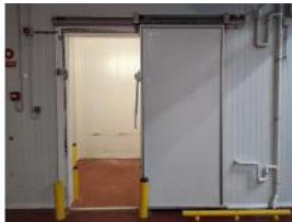
Referencia: FPN-078 PUERTA FRIGORIFICA CORREDERA Año: . Marca: INFRACA