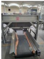
Referencia: PNS-069 TOLVA CON CINTA TRANSPORTADORA Año: 2004 Marca: MARTIN MAQ