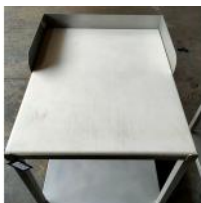
Referencia: MOR-156 MESA INOX CON ENCIMERA Año: . Marca: .