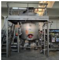
Referencia: FTR-042 SISTEMA DE MAKING PARA AGUA CA... Año: . Marca: .