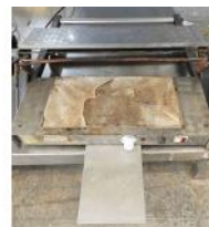
Referencia: FJD-019 ENVOLVEDORA MANUAL Año: . Marca: .