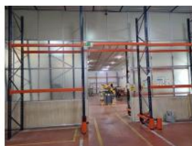
Referencia: TVE-058 ESTANTERIA METALICA Año: . Marca: .