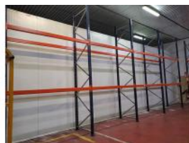
Referencia: TVE-055 ESTANTERIA METALICA Año: . Marca: .