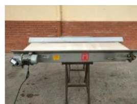
Referencia: PNS-042 CINTA TRANSPORTADORA DE BANDA ... Año: 2003 Marca: MARTIN MAQ