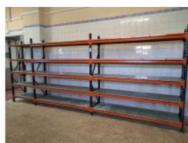
Referencia: TVE-096 ESTANTERIA METALICA Año: . Marca: MECALUX