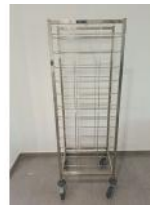
Referencia: CPM-040 CARRO BANDEJERO Año: 2019 Marca: DISTFORM