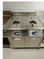
Referencia: CPM-008 FREIDORA A GAS Año: 2018 Marca: ELECTROLUX