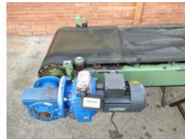
Referencia: PNS-035 CINTA TRANSPORTADORA DE BANDA ... Año: . Marca: .