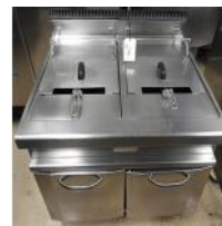
Referencia: AUR-006 FREIDORA INDUSTRIAL A GAS Año: 2003 Marca: MAS BAGA