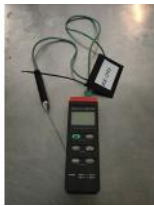
Referencia: MOR-098 TERMOMETRO DIGITAL Año: . Marca: HIT ITALIA