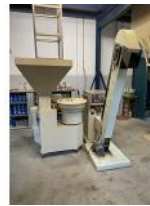
Referencia: NRM-006 LINEA DE MARCAJE A TINTA PARA ... Año: 2006 Marca: AZEBEDOS INDUSTRIA