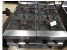
Referencia: AUR-004 COCINA INDUSTRIAL A GAS DE 4 F... Año: . Marca: ZANUSSI