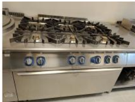
Referencia: CPM-006 COCINA A GAS Año: 2018 Marca: ELECTROLUX