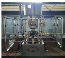
Referencia: BCH-129 TAPONADORA PARA TAPON DE CORCHO Año: . Marca: BERTOLASO