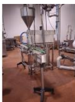
Referencia: DUL-117 EQUIPO DOSIFICADOR SEMI AUTOMATICO Año: . Marca: DOSIMAQ