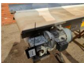
Referencia: PNS-039 CINTA TRANSPORTADORA DE BANDA ... Año: 2003 Marca: MARTIN MAQ