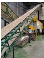
Referencia: MZA-039 CINTA TRANSPORTADORA Año: . Marca: TREICO