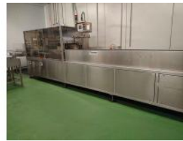
Referencia: AGL-060 TERMOSELLADORA AL VACIO Año: 2004 Marca: VACUUMPUMP