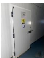
Referencia: NTM-187 PUERTA DE CAMARA FRIGORIFICA Año: . Marca: .