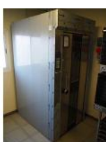
Referencia: PCN-009 HORNO DE COCCION Año: 2015 Marca: RAMALHOS