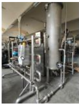
Referencia: FTR-020 CARBONATADOR Año: . Marca: .