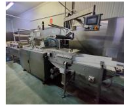
Referencia: NTM-048 TERMOSELLADORA ENCAPSULADORA Año: 2013 Marca: MECAPACK