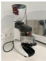
Referencia: CPM-020 MOLINILLO DE CAFE Año: 2017 Marca: COMPAK CAFENTO