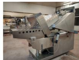
Referencia: MOR-003 LONCHEADORA AUTOMATICA Año: 1995 Marca: DIXIE UNION