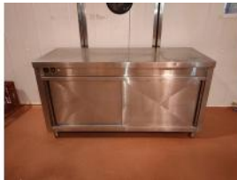
Referencia: DUL-127 MESA CALIENTE Año: . Marca: .