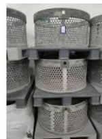
Referencia: TVE-047 CESTAS DE AUTOCLAVE Año: . Marca: .