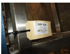
Referencia: GBF-023 VIBRADOR DOSIFICADOR Año: . Marca: VIBRANT