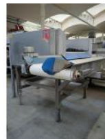
Referencia: PNS-072 MESA DE RODILLOS CON CINTA TRA... Año: . Marca: MARTIN MAQ