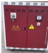
Referencia: FPN-162 BATERIA DE CDOMPENSACION AUTOMATICA Año: . Marca: CIRCUTOR