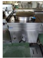
Referencia: DUL-038 MARMITA DIRECTA DE GAS Año: . Marca: REPAGAS