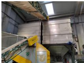
Referencia: MZA-008 TOLVA DE ALMACENAMIENTO Año: 2018 Marca: .