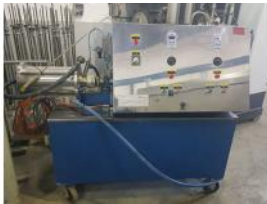
Referencia: CCMA-007 AIREADORA Año: 2007 Marca: AUSTRO MAQUINAS