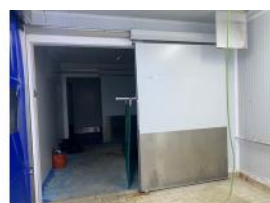
Referencia: NTM-158 PUERTA FRIGORIFICA CORREDERA Año: . Marca: .