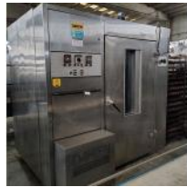
Referencia: PCB-029 HORNO INDUSTRIAL Año: . Marca: DAHLEN