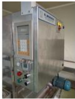
Referencia: MOR-101 TERMOSELLADORA DE BANDEJAS Año: 1992 Marca: G. MONDINI