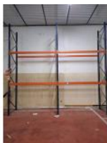
Referencia: TVE-056 ESTANTERIA METALICA Año: . Marca: .