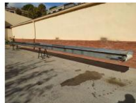
Referencia: PNS-021 CINTA TRANSPORTADORA DE BANDA ... Año: 2003 Marca: MARTIN MAQ