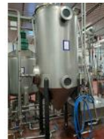
Referencia: TVE-021 TANQUE INOX Año: . Marca: .