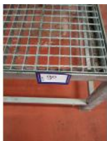
Referencia: TVE-090 PLATAFORMA INOX Año: . Marca: RISCO