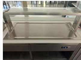
Referencia: CPM-026 PLACA DE CRISTAL PARA EXHIBIR ... Año: 2019 Marca: DISTFORM