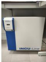
Referencia: DUL-082 INCUBADORA MICROBIOLOGICA Año: 2009 Marca: VMR