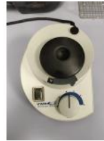
Referencia: DUL-085 AGITADOR PARA TUBOS DE MUESTRA Año: . Marca: VWR