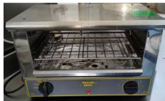
Referencia: NTM-015 TOSTADORA Año: . Marca: ROLLER GRILL