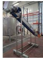
Referencia: TVE-067 ELEVADOR DE PRODUCTO Año: . Marca: .