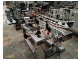
Referencia: MZA-033 ETIQUETADORA LINEAL Año: 2018 Marca: .