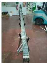
Referencia: TVE-045 CINTA TRANSPORTADORA DE CHARNE... Año: . Marca: .