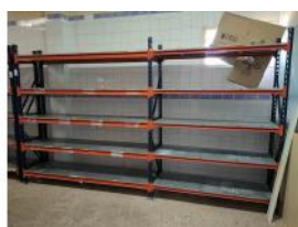
Referencia: TVE-095 ESTANTERIA METALICA Año: . Marca: MECALUX