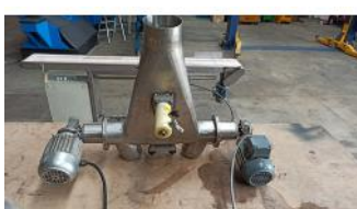
Referencia: NCC-210 SISTEMA DE DOSIFICACION Año: . Marca: BONFIGLIOLI GROUP