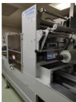
Referencia: MOR-107 ENVASADORA TERMOFORMADORA POR ... Año: 1994 Marca: MULTIVAC