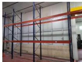
Referencia: TVE-057 ESTANTERIA METALICA Año: . Marca: .