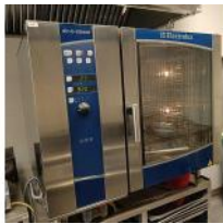
Referencia: CPM-001 HORNO ELECTRICO Año: 2018 Marca: ELECTROLUX