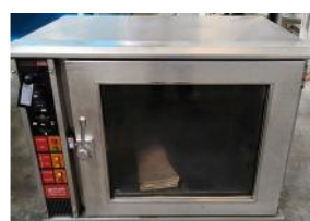
Referencia: PCB-005 HORNO ELECTRICO Año: . Marca: GOUET ESPAÑOLA