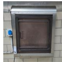
Referencia: NTM-046 ESTERILIZADOR DE CUCHILLOS Año: . Marca: BOURGEAT