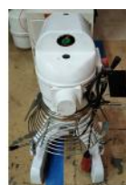
Referencia: PCB-016 MEZCLADOR PLANETARIO Año: . Marca: DIVIMASA