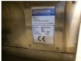
Referencia: MOR-227 SOLDADORA POR ULTRASONIDO Año: 2004 Marca: OSNOVA