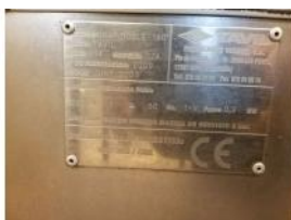
Referencia: MOR-198 GRAPADORA RECONVERTITA A SOLDADORA Año: . Marca: TAVIL