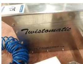
Referencia: MOR-218 MAQUINA RETORCEDORA DE TRIPA N... Año: 1995 Marca: .