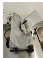
Referencia: CPM-038 CORTA FIAMBRES Año: 2018 Marca: MEAT SLICER