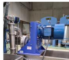
Referencia: MZA-012 MOLINO TRITURADOR Año: 2004 Marca: ALFA LAVAL