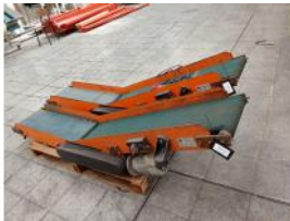
Referencia: PNS-051 CINTA TRANSPORTADORA Año: . Marca: EMPAC S.A