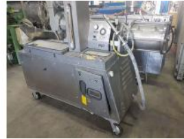
Referencia: CCMA-006 AIREADORA Año: . Marca: HANSAWERKE