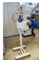
Referencia: HIP-004 SISTEMA DE CORTE Año: 2009 Marca: ANGLES