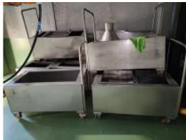
Referencia: MZA-018 CARRO PARA TRASIEGO DE ACEITE Año: . Marca: .