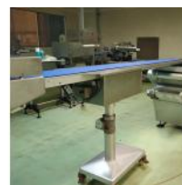
Referencia: MOR-283 CINTA TRANSPORTADORA Año: 1992 Marca: DIXIE UNION