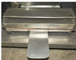
Referencia: FJD-020 ENVOLVEDORA MANUAL Año: . Marca: .