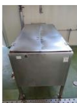
Referencia: AGL-086 COCEDERO INOX Año: . Marca: .