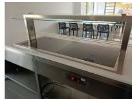
Referencia: CPM-024 PLACA DE CRISTAL PARA EXHIBIR ... Año: 2019 Marca: DISTFORM