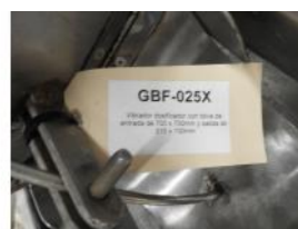
Referencia: GBF-025 VIBRADOR DOSIFICADOR Año: . Marca: .