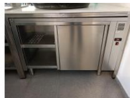
Referencia: CPM-027 ARMARIO CALIENTE Año: 2018 Marca: DISTFORM