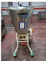
Referencia: TVE-088 MOLINO PARA VEGETALES Año: . Marca: .