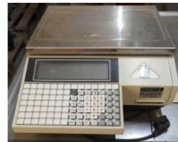
Referencia: FJD-016 BASCULA DIGITAL Año: 2007 Marca: EPELSA