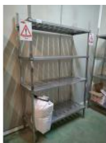
Referencia: AGL-019 ESTANTERIA INOX Año: . Marca: .