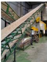
Referencia: MZA-039 CINTA TRANSPORTADORA Año: . Marca: TREICO