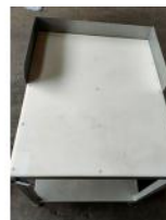
Referencia: MOR-159 MESA INOX CON ENCIMERA Año: . Marca: .