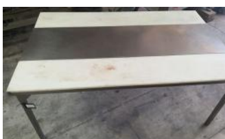
Referencia: MOR-171 MESA INOX CON EXTREMOS Año: . Marca: .