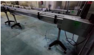
Referencia: NTM-055B CINTA TRANSPORTADORA Año: 2015 Marca: INOX-FERRO SANCHEZ S.L