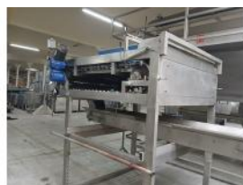
Referencia: PNS-047 ESTACION DE REPASO VISUAL Año: 2003 Marca: MARTIN MAQ