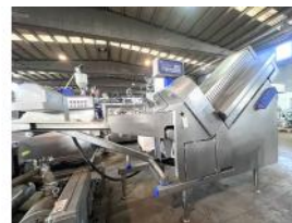
Referencia: SSM-019 LONCHEADORA AUTOMATICA Año: 2003 Marca: CONVENIENCE FOOD SYSTEMS