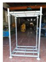
Referencia: PNS-055 PORTA BIG-BAGS Año: . Marca: .