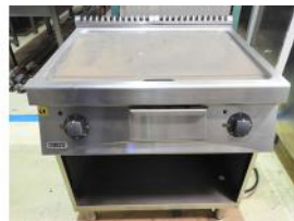
Referencia: NCC-164 PLANCHA ELECTRICA INDUSTRIAL Año: . Marca: ZANUSSI