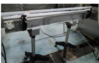
Referencia: NTM-050 CINTA TRANSPORTADORA Año: 2015 Marca: INOX-FERRO SANCHEZ S.L