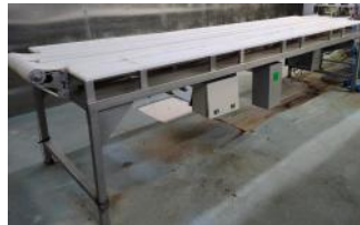
Referencia: NTM-047 MESA DE PREPARACION Año: . Marca: TALLERS D'HOSTOLES