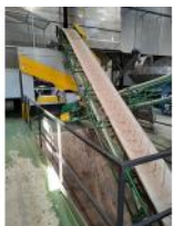
Referencia: MZA-003 CINTA TRANSPORTADORA Año: 2018 Marca: TREICO