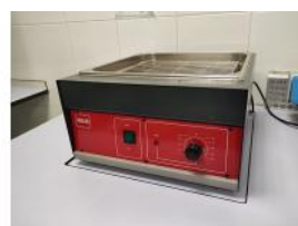
Referencia: DUL-084 BAÑO TERMOSTATICO Año: 2009 Marca: INDELAB