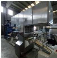
Referencia: PCB-025 LINEA DE FORMADO DE BARRAS DE PAN Año: . Marca: SUBAL