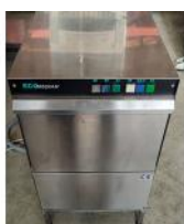
Referencia: PCB-015 LAVAVASOS Año: . Marca: ECOPROGRAM