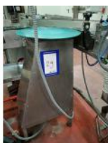
Referencia: TVE-029 PLATO GIRATORIO Año: . Marca: .