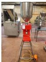
Referencia: MOR-216 LLENADORA/DOSIFICADOR A DE PRODUCTOS Año: . Marca: .