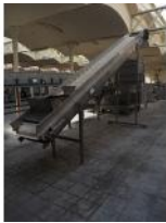
Referencia: PNS-073 ELEVADOR DE PRODUCTO Año: 2003 Marca: MARTIN MAQ