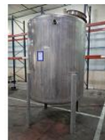
Referencia: TVE-065 DEPOSITO INOX Año: . Marca: J. SERRA