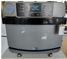
Referencia: NTM-014 HORNO ELECTRICO DE COCCION RAPIDA Año: 2017 Marca: TURBOCHEF TECHNOLOGIES