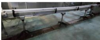
Referencia: NTM-049 CINTA TRANSPORTADORA DE CHARNE... Año: 2015 Marca: INOX-FERRO SANCHEZ S.L