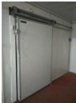
Referencia: FPN-090 PUERTA FRIGORIFICA CORREDERA Año: . Marca: .