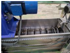
Referencia: MZA-013 MEZCLADORA AMASADORA Año: . Marca: RUFFINI ROMOLO