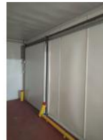
Referencia: FPN-091 PUERTA FRIGORIFICA CORREDERA Año: . Marca: INFRACA