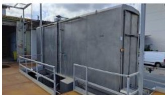
Referencia: FPN-070 TUNEL DE LAVADO Año: 2017 Marca: XUCLÀ