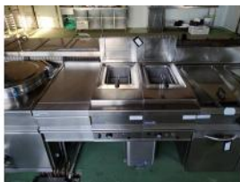
Referencia: DUL-032 FREIDORA INDUSTRIAL Año: . Marca: REPAGAS