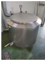
Referencia: AGL-085 MARMITA DE COCCION Año: . Marca: .