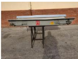
Referencia: PNS-034 CINTA TRANSPORTADORA DE BANDA ... Año: 2003 Marca: MARTIN MAQ