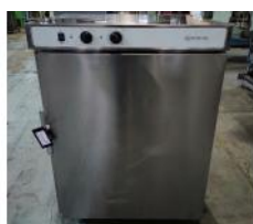
Referencia: GAU-009 HORNO DE RECALENTAMIENTO Año: 2010 Marca: GIORIK