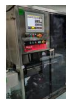
Referencia: NTM-051 DISPENSADOR DE ETIQUETAS Año: 2017 Marca: MACSA ID