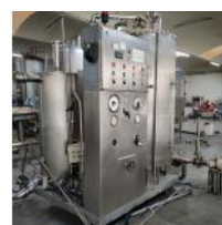
Referencia: FTR-018 CARBONATADOR Año: 1982 Marca: LA METALURGICA TEXTIL