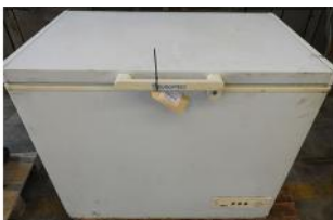
Referencia: FJD-011 ARCON CONGELADOR Año: . Marca: EUROFRED