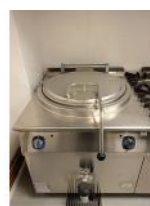
Referencia: CPM-005 MARMITA A COCCION A GAS Año: 2017 Marca: ELECTROLUX