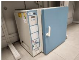
Referencia: DUL-093 ESTUFA DE PRECISION Año: . Marca: JP SELECTA