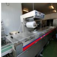
Referencia: AGL-073 TERMOFORMADORA/TERM OSELLADORA Año: 1993 Marca: ALFA LAVAL CONTEL