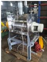
Referencia: NCC-039 MEZCLADORA PARA PRODUCTOS SOLIDOS Año: . Marca: .