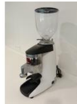
Referencia: CPM-019 MOLINILLO DE CAFE Año: 2017 Marca: COMPAK