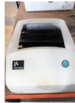
Referencia: NCC-087 IMPRESORA DE ETIQUETAS Año: . Marca: ZEBRA