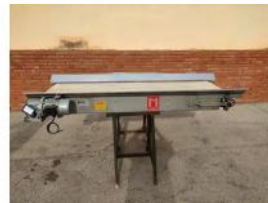
Referencia: PNS-032 CINTA TRANSPORTADORA DE BANDA ... Año: 2003 Marca: MARTIN MAQ