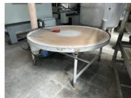
Referencia: PNS-003 PLATO DE ACUMULACION Año: . Marca: .