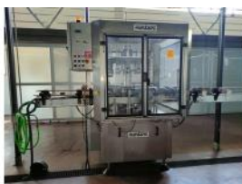
Referencia: BCH-131 RULINADORA Año: 1999 Marca: NORTAN