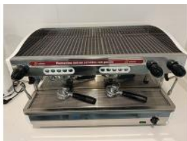
Referencia: CPM-021 CAFETERA ESPRESSO Año: . Marca: CAFENTO