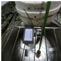
Referencia: PCB-017 AMASADORA MEZCLADORA Año: . Marca: TAM S.A