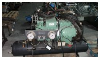
Referencia: MOR-197 EQUIPO DE FRIO Año: 2009 Marca: TORRECILLA COMP.FRIGORIFICOS