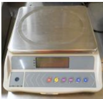
Referencia: FJD-015 BASCULA DIGITAL Año: 2012 Marca: PESATRONIC