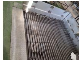
Referencia: MZA-002 TOLVA DE RECEPCION Año: 2018 Marca: .