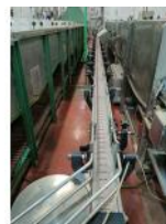
Referencia: TVE-031 CINTA TRANSPORTADORA DE CHARNE... Año: . Marca: .