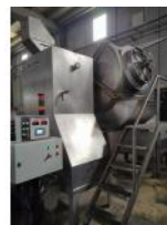
Referencia: SSM-050 REACTOR DE MASAJE Año: . Marca: .