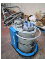
Referencia: TVE-085 ASPIRADOR PARA POLVO Año: . Marca: NILFISK