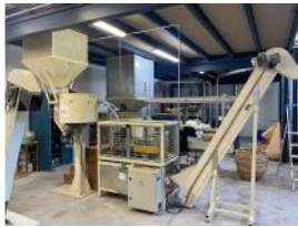
Referencia: NRM-005 LINEA DE MARCAJE PARA CORCHOS Año: 2006 Marca: MECANIKES PALAMÓS