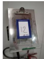
Referencia: TVE-012 APLIQUE ESCRITORIO Año: . Marca: .