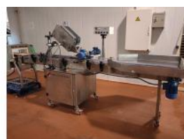
Referencia: DUL-014 LINEA DE ETIQUETADO Año: . Marca: CAB