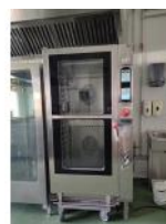
Referencia: DUL-033 HORNO A GAS Año: . Marca: REPAGAS