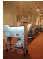
Referencia: DUL-002 LINEA DE PURES DE HORTALIZAS Y... Año: 2009 Marca: MARRODAN