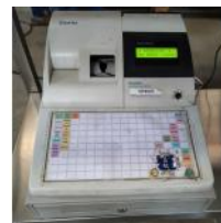
Referencia: PCB-011 CAJA REGISTRADORA Año: . Marca: SAM4S