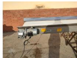
Referencia: PNS-040 CINTA TRANSPORTADORA DE BANDA ... Año: 2003 Marca: MARTIN MAQ