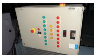
Referencia: MOR-244 EQUIPO DE FRIO Año: 2001 Marca: C+F