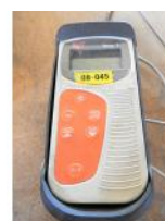
Referencia: NCC-085 TERMOMETRO Año: . Marca: EUTECH INSTRUMENTS