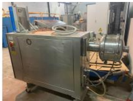
Referencia: CCMA-005 AIREADORA Año: 1996 Marca: MONDOMIX