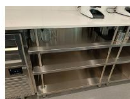
Referencia: CPM-023 MUEBLE SOTABANCO Año: . Marca: INFRICO