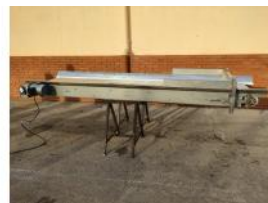
Referencia: PNS-038 CINTA TRANSPORTADORA DE BANDA ... Año: 2003 Marca: MARTIN MAQ