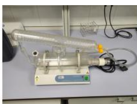
Referencia: DUL-092 DESTILADOR Año: 2008 Marca: JP SELECTA