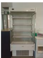
Referencia: CPM-029 MOSTRADOR VERTICAL Año: . Marca: INFRICO