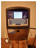
Referencia: DUL-008 CODIFICADOR INKJET Año: . Marca: VIDEOJET