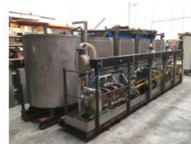
Referencia: MIC-002D COCINA DE ESPESANTES Año: . Marca: .