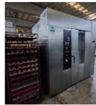
Referencia: PCB-028 HORNO INDUSTRIAL Año: . Marca: DAHLEN