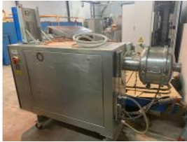
Referencia: CCMA-005 AIREADORA Año: 1996 Marca: MONDOMIX