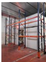
Referencia: TVE-054 ESTANTERIA METALICA Año: . Marca: .