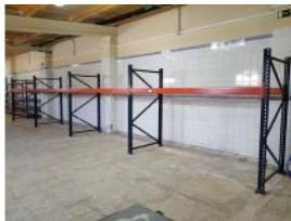
Referencia: TVE-097 ESTANTERIA METALICA Año: . Marca: MECALUX