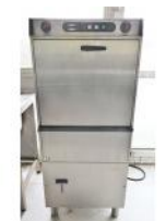
Referencia: NCC-166 LAVAPLATOS INDUSTRIAL Año: . Marca: JEMI