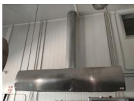
Referencia: DUL-028 CAMPANA EXTRACTORA Año: . Marca: TEC TEC