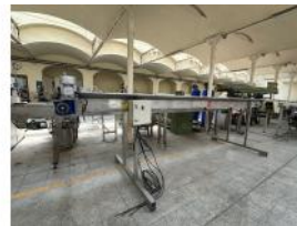
Referencia: PNS-056 CINTA TRANSPORTADORA Año: 2005 Marca: MARTIN MAQ