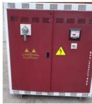
Referencia: FPN-162 BATERIA DE CDOMPENSACION AUTOMATICA Año: . Marca: CIRCUTOR