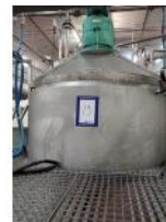
Referencia: TVE-019 TANQUE INOX Año: . Marca: .