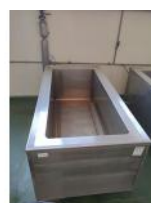
Referencia: AGL-087 COCEDERO INOX Año: . Marca: .