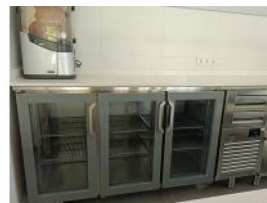
Referencia: CPM-017 FRENTE MOSTRADOR REFRIGERADO Año: 2018 Marca: INFRICO