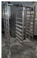
Referencia: GAU-023 CARRO PARA 18 BANDEJAS Año: . Marca: .