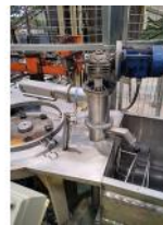
Referencia: MZA-014 LLENADORA AUTOMATICA Año: 2003 Marca: RUFFINI ROMOLO