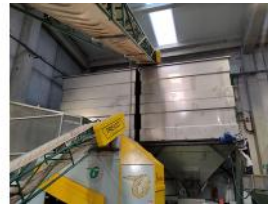
Referencia: MZA-007 TOLVA DE ALMACENAMIENTO Año: 2018 Marca: .