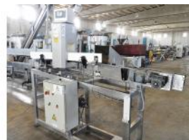
Referencia: NCC-034 SISTEMA DE INSPECCION POR RAYOS X Año: 2000 Marca: PRISMA