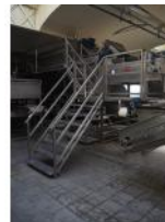
Referencia: PNS-011 LAVADORA PARA FRUTAS Y VERDURAS Año: . Marca: MARTIN MAQ