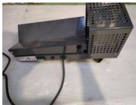
Referencia: MZA-037 ENCAPSULADORA MANUAL Año: 2020 Marca: ADMEL SNC