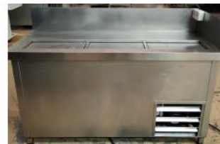
Referencia: PCB-002 BOTELLERO Año: . Marca: .