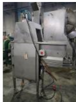
Referencia: SSM-030 INYECTORA DE 9 AGUJAS Año: . Marca: INJECT STAR