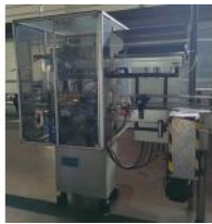
Referencia: BCH-130 DISPENSADOR/ALIMENTADOR DE CAPSULAS Año: . Marca: RAMONDIN