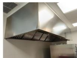
Referencia: CPM-037 CAMPANA EXTRACTORA Año: . Marca: .