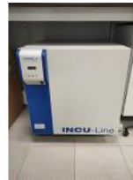
Referencia: DUL-083 INCUBADORA MICROBIOLOGICA Año: . Marca: VMR