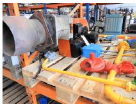
Referencia: NCC-141 QUEMADOR DE CALDERA Año: 1985 Marca: KLOCKNER