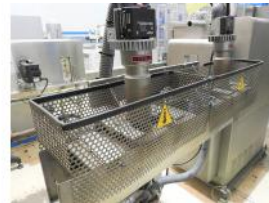
Referencia: NCC-126 SOPORTE CON CALEFACTORES REGULABLES Año: . Marca: RIPACK