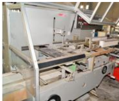
Referencia: PUI-002 ESTUCHADORA Año: 1999 Marca: CAM 7 SRL