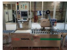
Referencia: MOR-084 TREN DE PESADO Y ETIQUETADO Año: 2004 Marca: TAVIL