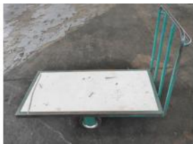
Referencia: MRT-082 CARRO DE TRANSPORTE Año: . Marca: .