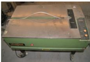
Referencia: ANT-017 FLEJADORA SEMI-AUTOMATICA Año: . Marca: STRAPEX