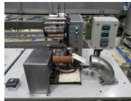
Referencia: CYP-029 ETIQUETADORA Año: . Marca: .