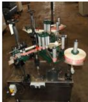
Referencia: AFG-005 ETIQUETADORA DE DOBLE CABEZAL Año: 2007 Marca: REVERSIBLE LABELLERS COMPANY