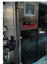
Referencia: NTM-064 DISPENSADOR DE ETIQUETAS Año: 2017 Marca: MACSA ID