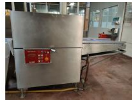
Referencia: MOR-077 TANQUE DE RETRACTILADO POR INM... Año: . Marca: INAUEN