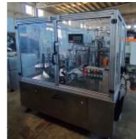
Referencia: FLT-001 ETIQUETADORA LINEAL DE DOBLE C... Año: 2005 Marca: ETIMA