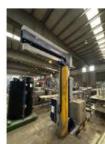
Referencia: IDL-001 ENVOLVEDORA DE PALETS Año: 2019 Marca: ROBOPACK