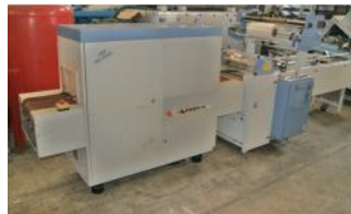
Referencia: SON-006 EMPAQUETADORA Año: 1997 Marca: CB EMBALLAGE