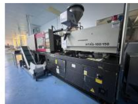
Referencia: PFP-004 INYECTORA Año: 2003 Marca: NINGBO HAITIAN