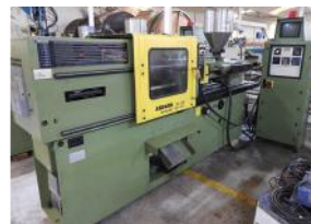
Referencia: GRB-002 INYECTORA DE PLASTICO Año: 1989 Marca: ARBURG ALLROUNDER