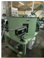
Referencia: ZIP-022 ALIMENTADOR DINAMICO Año: . Marca: TAD