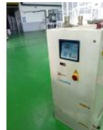
Referencia: PFP-007 SEDADOR DESHUMIFICADOR Año: 1997 Marca: MORETTO