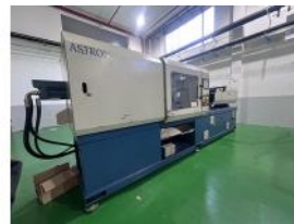
Referencia: PFP-002 INYECTORA Año: 2003 Marca: JONWAI