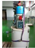
Referencia: PFP-011 ALIMENTADOR POR VACIO CON TOLVA Año: 2011 Marca: SHINI