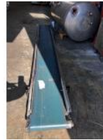
Referencia: ICS-015 CINTA TRANSPORTADORA Año: . Marca: .