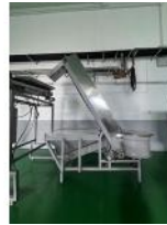
Referencia: PFP-009 TRANSPORTADOR ALIMENTADOR Año: . Marca: .