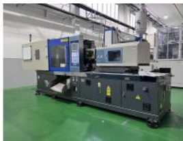
Referencia: PFP-001 INYECTORA Año: 2013 Marca: KAI MING