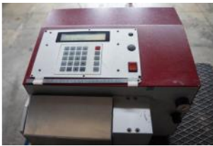
Referencia: SDC-009 MAQUINA ELECTRONEUMATICA DE CO... Año: . Marca: TEKUWA