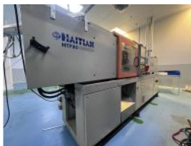
Referencia: PFP-003 INYECTORA Año: 2000 Marca: NINGBO HAITIAN