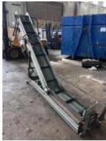
Referencia: ICS-014 CINTA ELEVADORA PRODUCTO Año: 1998 Marca: CRIZAF