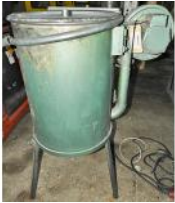
Referencia: GRB-011 SECADOR DE GRANZA Año: . Marca: .