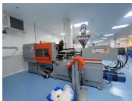
Referencia: PFP-005 INYECTORA Año: 1986 Marca: SANDRETTO