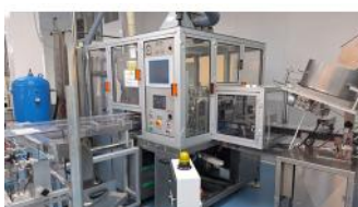
Referencia: PFP-012 LINEA AUTOMATICA DE DOSIFICACION Año: 2012 Marca: REBEL, S.A.