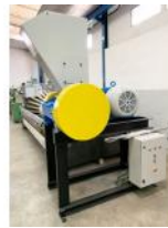
Referencia: ALS-004 MOLINO DESGARRADOR PARA PLÁST... Año: . Marca: .